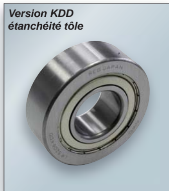
Galets de guidage à double rangées de billes