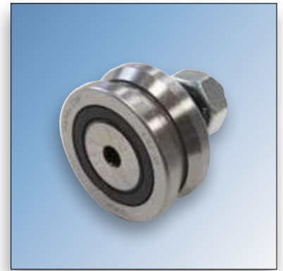
Galet profilé en V à 120° pour GD10 / GD20 / GDX20