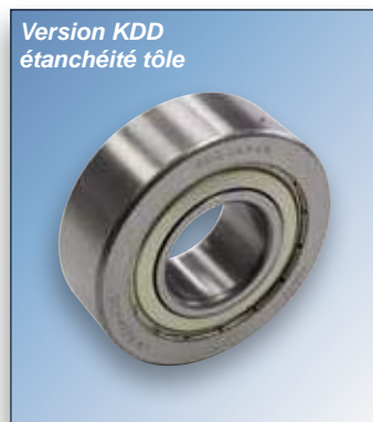
Galets de guidage à double rangées de billes